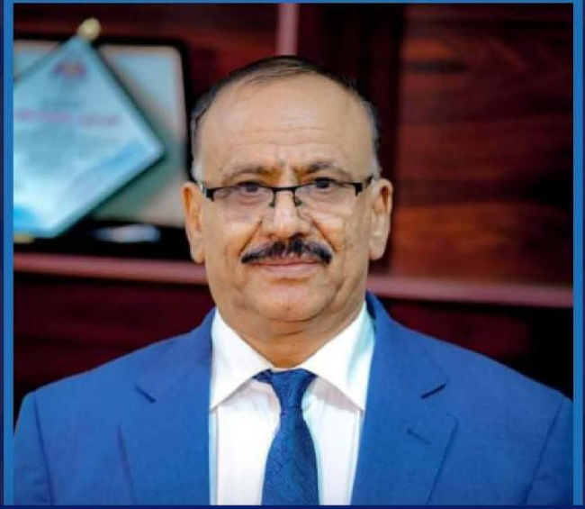
د. عبدالسلام صالح حميد وزير النقل

اليمن كافة وكل ما يشمل من أحداث ومجريات عربية وعالمية اولا بأول في مجال الطيران.