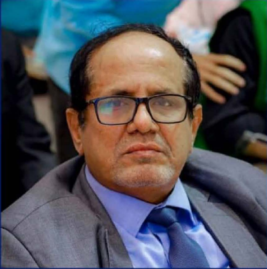
كابتن/ صالح سليم بن نهيد رئيس الهيئة العامة للطيران المدني والأرصاد